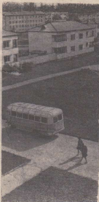
ЭСТОНСКАЯ ССР. В этом поселке живут строители, рабочие совхоза «Саку».

— Да, Комплексная программа — это новый, более высокий этап сближения стран социализма. Она разработана на основе требований современного уровня научно-технической революции, учета огромных преимуществ социалистической системы хозяйства, достигнутой зрелости экономического развития стран СЭВ, которые плодотворно сотрудничают более двух десятилетий. Они выпускают почти