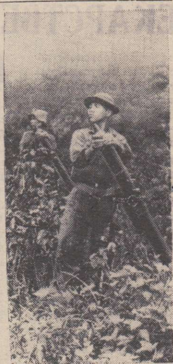
Южный Вьетнам. Патриоты Армии освобождения подвергают интенсивному минометному обстрелу базы американо-сайгонских войск.

Беседу провела К. СКАЧКО. (Пресс-бюро «Правды».)